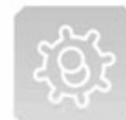
BIOSAN protezione batteri