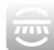
SLS Spazzola autolivellante