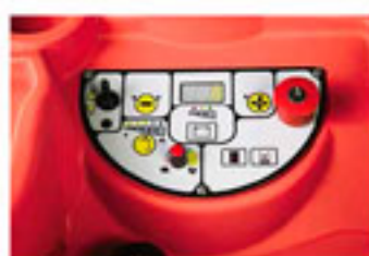
Pannello comandi intuitivo e impermeabile